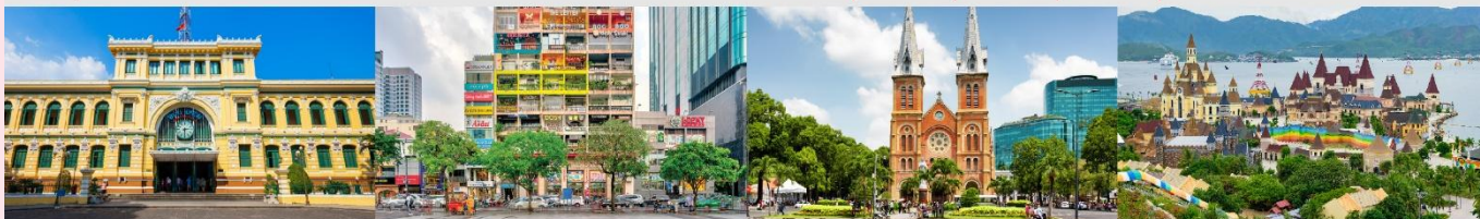
ไพรเซนต์ยักกลางโฮจิมินห์