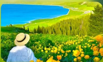
ทะเลสาบไซท์ลี่มู่