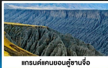
แกรนด์แคนยอนคู่ชานจื่อ