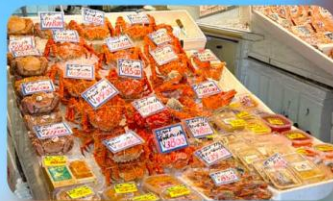
ตลาดปลาโจโก