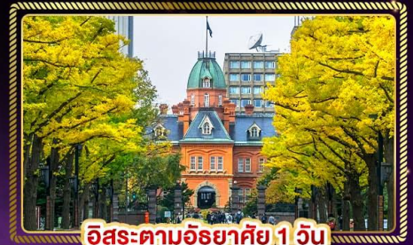
ฮิโรสะตามอริยาตสึ 1 วัน

น้ำหนักกระเป๋า 20 Kg. บริการอาหาร บนเครื่อง ไป-กลับ