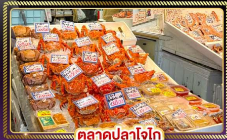
ตลาดปลาโอไก