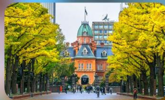
อัสระตามอริยาศัย 1 วัน