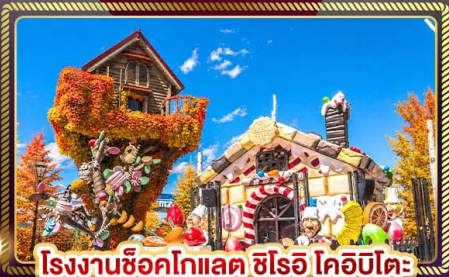
โรงงานช็อคโกแลต ชิโรอิ โคอิบิตะ