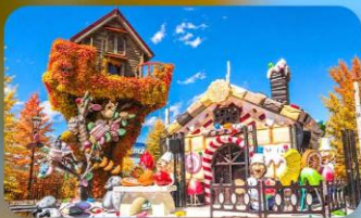
โรงงานช็อกโกแลต ชิโรอิ โคอิบิโตะ