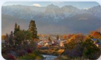
โออิเดะ ปาร์ค