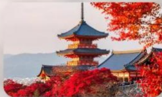
วัดคิโยมิชิ