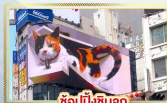
ซูปป์ชินจูกุ