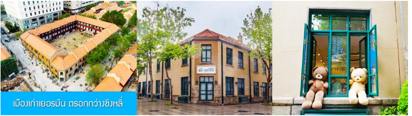
เมืองเก่าเยอรมัน ตรอกกว้างชิงลี่

จากนั้นเดินทางต่อ สู่ย่าน เมืองเก่าเยอรมัน ตรอกกว้างชิงลี่ 广兴里 ตรอกชอกชอยที่เรียงรายไปด้วยอาคารสถาปัตยกรรมแบบ ผสมผสานจีนและอาคารสไตล์ยุโรป