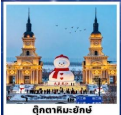
ตึกคาทอลิก