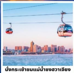
นั่งกระเช้าชมแม่น้ำขงฮวาเจียง