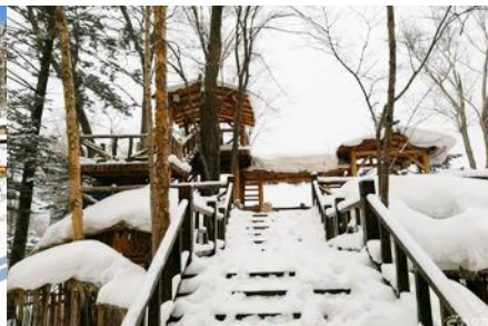
ระเบียงชมวิวยิ่งดูซาบ

วันที่สาม เมืองฮาร์บิน-สถานีรถไฟยาบูลี-รวมนั่งม้าลากเลื่อน- หมู่บ้านหิมะ Xue xiang China Snow Town – ระเบียงชมวิวยิ่งดูซาบ- ชมแสงสียามราตรีหมู่บ้านหิมะ-ชมพลุไฟและขบวนพาเหรดระบำพื้นเมือง-นอนในหมู่บ้านหิมะ Xue xiang