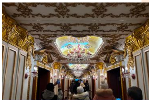
ตึกเภสัชกรรมฮาร์บิน

จากนั้นนำท่านเที่ยวชม ถนนมายังฤดู 中央大街 ถนนสายหลักของเมืองฮาร์บิน ถนนที่เต็มไปด้วยอาคารบ้านเรือนที่เป็นสถาปัตยกรรมตะวันตกที่สร้างในช่วงคริสต์ศตวรรษที่ 18 – 19 ที่เมืองนี้ถูกปกครองโดยรัสเซีย อีกทั้งเป็นถนนคนเดินที่เป็นแหล่งรวมร้านค้าสินค้าแบรนด์เนมทั้งในและต่างประเทศ ร้านจำหน่ายของที่ระลึกและสินค้าพื้นเมือง ร้านอาหารพื้นเมืองต่าง ๆ มากมาย ให้ท่านมีเวลาอิสระเดินเที่ยวและช้อปปิ้ง หรือลิ้มรสอาหารพื้นเมืองตามอัธยาศัย.. **ให้ท่านลิ้มรสไอศกรีมชื่อดังเก่าแก่ของเมืองฮาร์บินท่านละ 1 ท่านฟรี