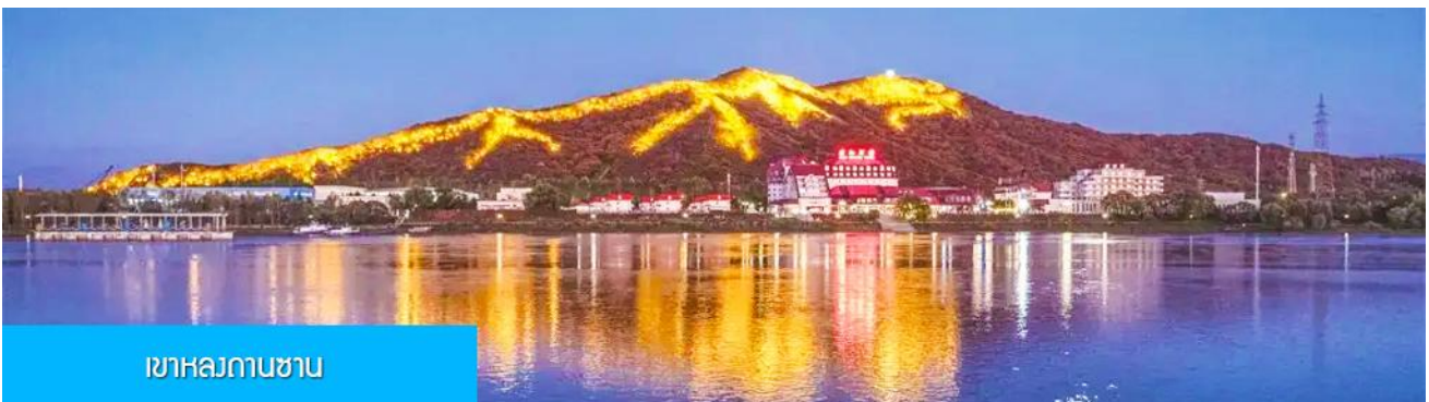
เขาสวยงาม

หลังอาหารนำท่านผ่านชม วิวยามค่ำของเขา หลงถานซาน 龙潭山夜景 (ผ่านชมระยะไกล) ภูเขารูปทรงคล้ายมังกรในช่วงกลางคืนภูเขาถูกประดับด้วยแสงไฟที่สามารถมองเห็นแต่ไกล คล้ายรูปมังกร (บางคนมองว่าคล้ายรูปไดโนเสาร์) จากนั้นนำท่านเดินทางเข้าที่พัก