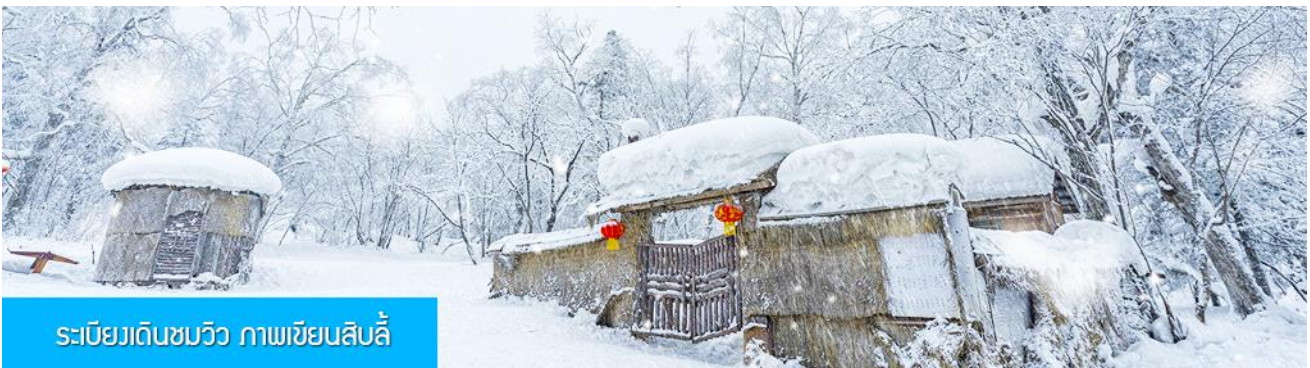
ระเบียงเดินชมวิว ภาพเขียนสิบลี้