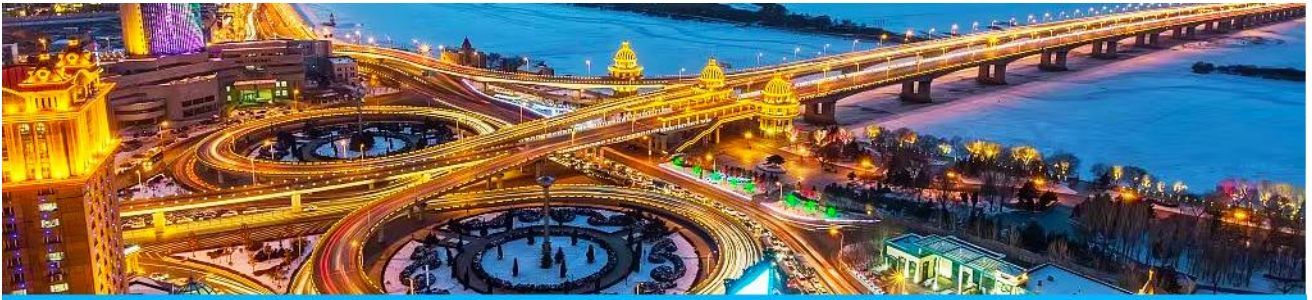
นครฮาร์บิน