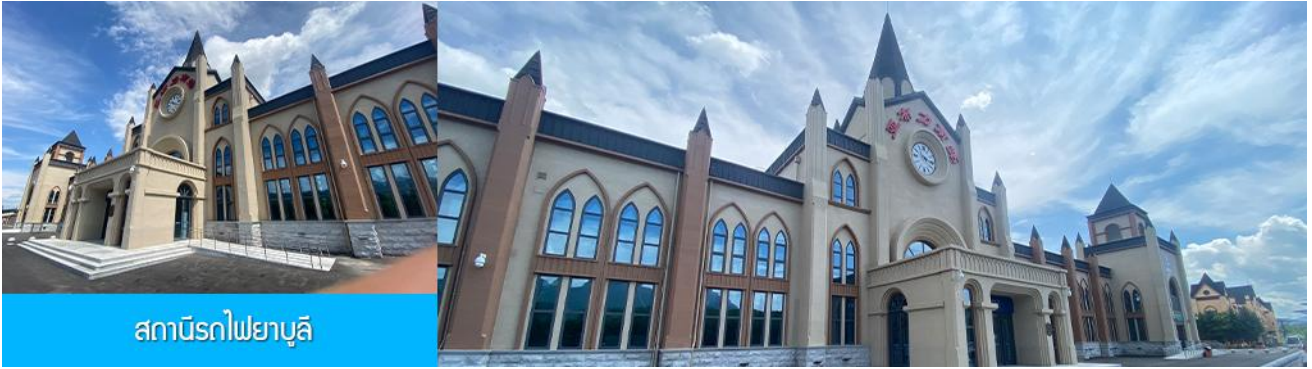
สถานีรถไฟยบูลี

นำท่านเที่ยวชม สถานีรถไฟยบูลี 亚布力南站 (ชมด้านนอก) ได้ชื่อว่าเป็นสถานีรถไฟที่สวยงามที่สุดของจีน โดดเด่นด้วยสถาปัตยกรรมแบบตะวันตก ให้ท่านเก็บภาพบรรยากาศความสวยงามของสถานีรถไฟที่ปัจจุบันยังคงเปิดให้บริการอยู่