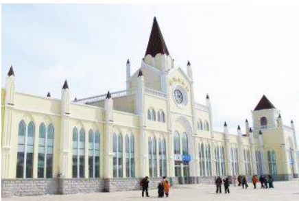
สถานีรถไฟยาบูลี

หมายเหตุ เพื่อความสะดวกในการเข้าพักใน HOME STAY ภายในหมู่บ้านหิมะ ทางทัวร์แนะนำให้ท่านจัดเตรียมเสื้อผ้าและเครื่องใช้เท่าที่จำเป็น 1 ชุดใส่กระเป๋าใบเล็กหรือเป้แบบสะพายได้ เพื่อสะดวกในการนำติดตัวไปใช้สำหรับคืนที่นอนในหมู่บ้านหิมะ หากนำกระเป๋าเดินทางใบใหญ่เข้าสู่ที่พักในหมู่บ้านอาจสร้างความไม่สะดวกแก่ท่าน จึงไม่แนะนำ