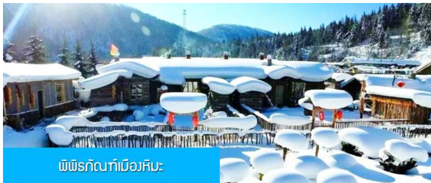
ພິພິຣັດທ໌ເມືອງຮີມະ

ภายในโฮมสเตย์จะมีสปูเหลว แชมพูภายในห้องน้ำ แปรงสีฟันยาสีฟัน แต่จะไม่มีหมวกคลุมผมสำหรับสุภาพสตรี ควรเตรียมไปด้วย