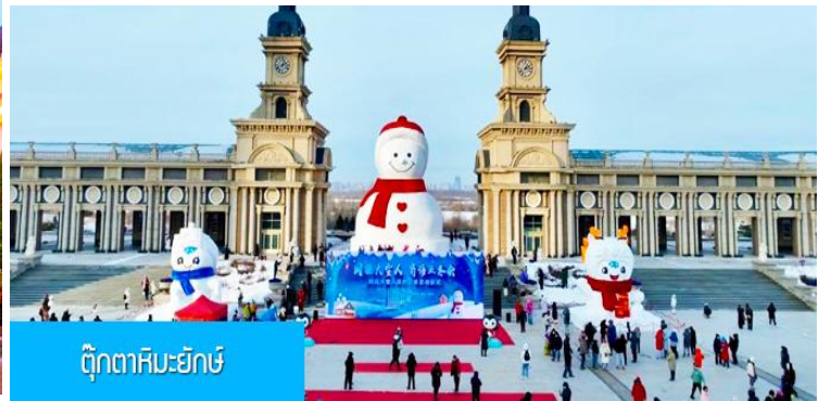
ตึกตาสหะยักซ์