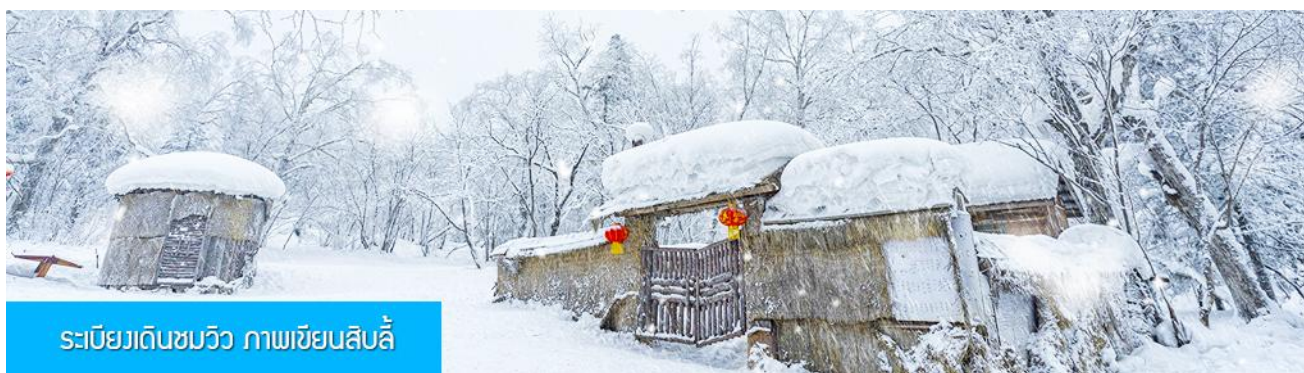
ຣະເບີຍງເດີນໝວິວ ກາພເຢັນສິບລີ້

จากนั้นให้ท่านอิสระ ตามอัธยาศัย หรือ ไกด์ท้องถิ่นนำเสนอโปรแกรมเสริม หรือ OPTIONAL TOUR ให้ท่านเลือกตามความสมัครใจ ***อิสระอาหารกลางวัน และ อาหารค่ำ เพื่อให้ท่านสะดวกในการพักผ่อนอย่างเต็มสุข