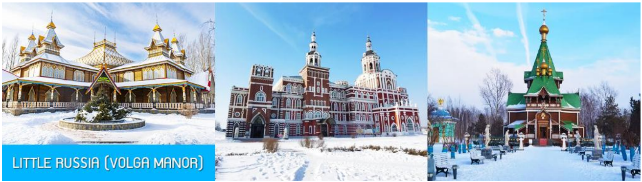
LITTLE RUSSIA (VOLGA MANOR)

จากนั้นนำท่านเที่ยวชม สวน LITTLE RUSSIA (VOLGA MANOR) 伏尔加庄园 สวนคฤหาสน์ที่ออกแบบคล้ายพระราชวังสไตล์รัสเซียในยุคกลาง บนเนื้อที่กว่า 600,000 ตารางเมตร แหล่งท่องเที่ยวระดับ 4A และเป็นศูนย์แลกเปลี่ยนทางวัฒนธรรมจีนและรัสเซีย อาคารทุกหลังภายในสวนแห่งนี้ล้วนถูกออกแบบอย่างปราณีตโดยสถาปนิกชาวรัสเซีย ประกอบด้วยอาคารและคฤหาสน์हरुสไตล์รัสเซียที่โดดเด่นด้วยเอกลักษณ์ อาทิ วิหาร โรงแรม ภัตตาคาร พิพิธภัณฑ์ศิลปะ โบสถ์คริสต์ต่อโชคดอกซ์ โรงเหล้าอดก้า ฯลฯ ที่แวดล้อมด้วยต้นไม้สวนหย่อม ธารน้ำ สะพานไม้ เป็นแหล่งท่องเที่ยวสไตล์รัสเซียที่มีมุมเก็บภาพและจุดเช็คอินเก๋ไก๋มากที่สุดในเมืองฮาร์บิน. ให้ท่านเดินเล่น และเก็บภาพตามมุมสวยในสวนที่เปลี่ยนไปเป็นลานหิมะ สวยงามแปลกตา