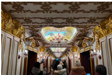
ตึกเภสัชกรรมฮาร์บิน

จากนั้นนำท่านเที่ยวชม ถนนจงย้ง 中央大街 ถนนสายหลักของเมืองฮาร์บิน ถนนที่เต็มไปด้วยอาคารบ้านเรือนที่เป็นสถาปัตยกรรมตะวันตกที่สร้างในช่วงคริสต์ศตวรรษที่ 18 – 19 ที่เมืองนี้ถูกปกครองโดยรัสเซีย อีกทั้งยังเป็นถนนคนเดินที่เป็นแหล่งรวมร้านค้าสินค้าแบรนด์เนมทั้งในและต่างประเทศ ร้านจำหน่ายของที่ระลึกและสินค้าพื้นเมือง ร้านอาหารพื้นเมืองต่าง ๆ มากมาย ให้ท่านมีเวลาอิสระเดินเที่ยวและช้อปปิ้ง หรือลิ้มรสอาหารพื้นเมืองตามอัชยาศัย.. **ให้ท่านลิ้มรสไอศกรีมชื่อดังเก่าแก่ของเมืองฮาร์บินท่านละ 1 ท่านฟรี