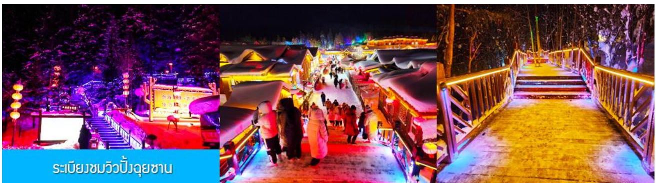
ระเบียบขบวนวิปัสยชน

รับประทานอาหารค่ำ ณ ร้านอาหารพื้นเมืองในเมืองหิมะ (6)