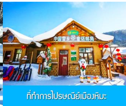
ທີ່ກຳກຳການໂປຣເຊນຢີເມືອງຮີມະ

วันที่สี่ พิพิธภัณฑ์เมืองหิมะ –ที่ทำการไปรษณีย์เมืองหิมะ–ออฟชั่นอุทยานภาพเขียนสิบลี้