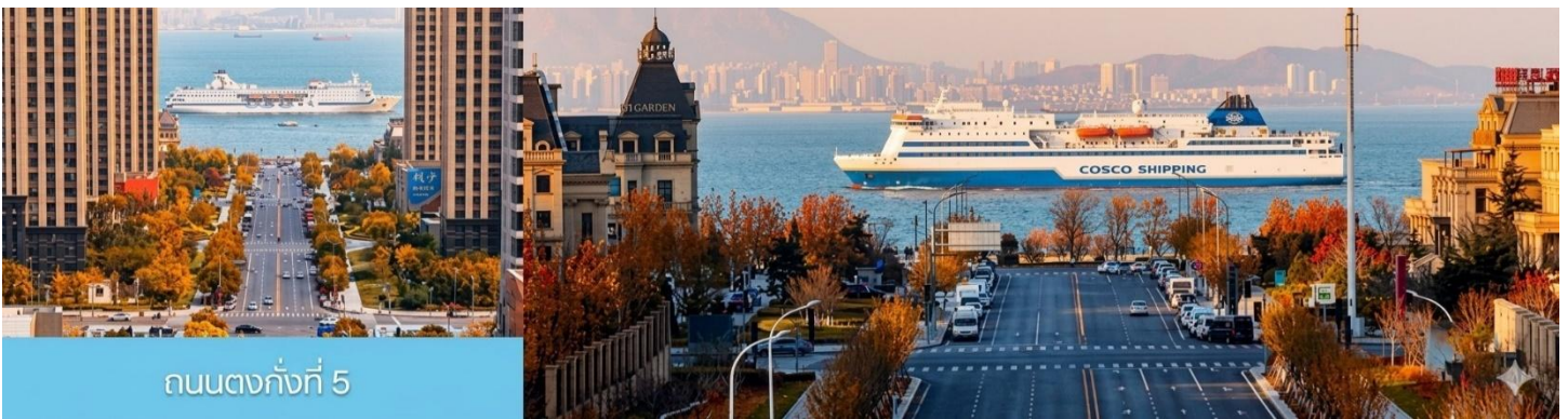
ถนนตงกั้งที่ 5

จากนั้นนำท่านเที่ยวชม สวนน้ำเมืองเวนิสตะวันออก 大连东方威尼斯城 เป็นเมืองเวนิสจำลองที่ถูกสร้างขึ้นด้วยทุนกว่า 8,000 ล้านบาท ออกแบบโดยบริษัท ARC จากประเทศฝรั่งเศส โดยจำลองผังเมืองเวนิสในประเทศอิตาลี บนพื้นที่กว่า 400,000 ตารางเมตร ประกอบด้วยคลองเวนิสและอาคารที่มีสถาปัตยกรรมแบบตะวันตกกว่า 200 หลัง มีบริการล่องเรือคอนโดล่าแก่นักท่องเที่ยว นำท่านเดินชม ถ่ายภาพที่ระลึกท่ามกลางอาคารสไตล์ยุโรป ตามอัธยาศัย.