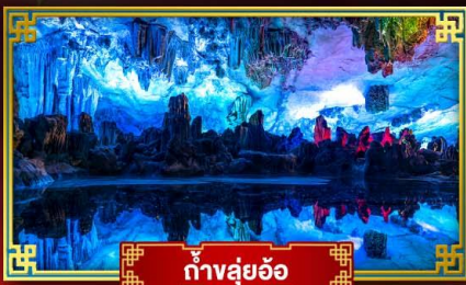
ทิวสวยอ้อ

"ดินแดนแห่งสายน้ำและขุนเขา" สัมผัสประสบการณ์นั่งบอลลูนชมวิวมุมสูง