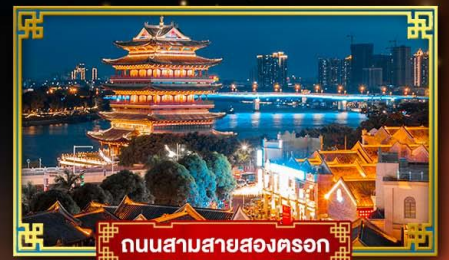
ถนนสามสายสองนครก