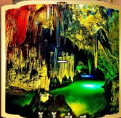
ถ้ำน้ำเป็นซี