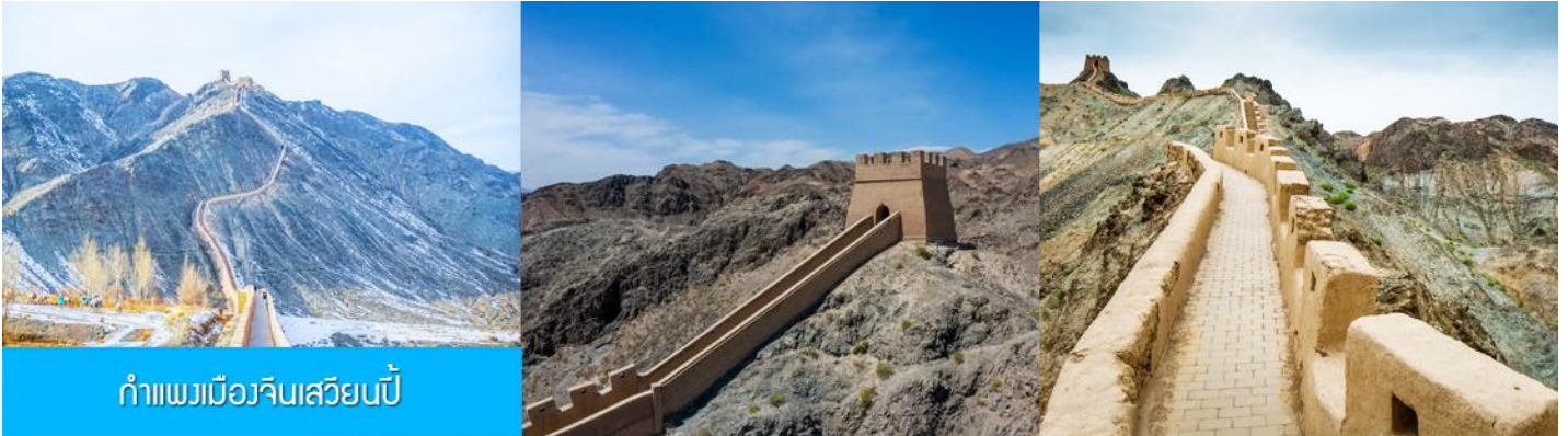
กำแพงเมืองจีนเสวียนเป่