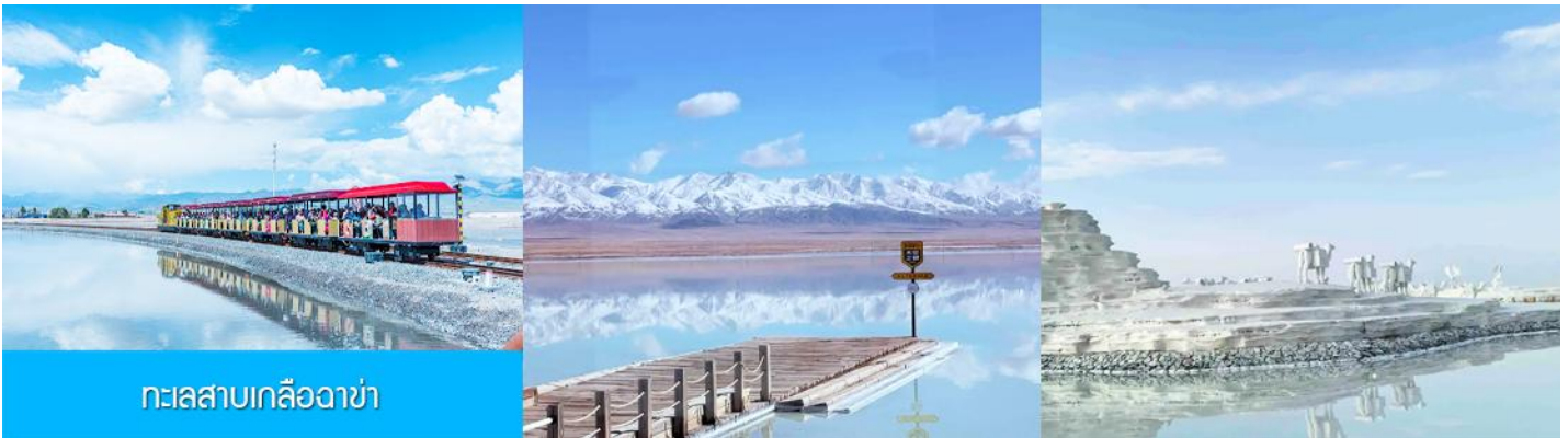
ทะเลสาบเกลือฉาปา

หลังอาหารนำท่านเดินทางโดยรถบัสสู่ทะเลสาบฉาปา (ระยะทาง 289 กม. ใช้เวลาเดินทางราว 3 ชั่วโมงเศษ)