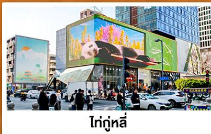
ไท่กู่หลี่