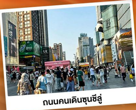
ถนนคนเดินชุนซีอู่