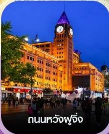
ถนนหลวงฟู้จิ่ง