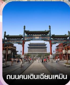
ถนนคนเดินเฉียนเหมิน

✈️ คอนเฟิร์มออกเดินทาง ทุกพีเรียด 2 ท่านขึ้นไป