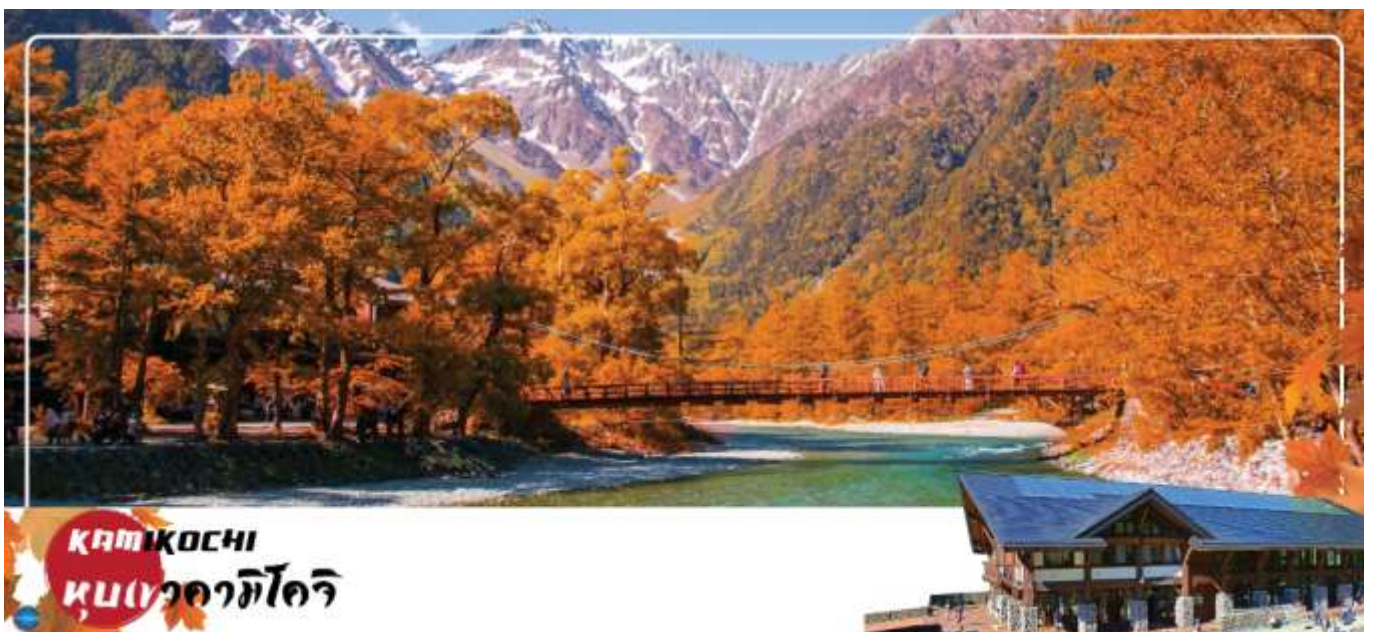
คามิโคจิ หมู่บ้านคามิโคจิ

วันที่สี่ เมืองโทนามิ – จังหวัดนากาโน่ – คามิโคจิ – สะพานกัปปะ – เมืองทาคายามะ – ถนนชั้นมาจิซุจิ – สะพานนาคะบาชิ – ที่ทำการเก่าเมืองทาคายามะ(ด้านนอก) – เมืองนาโกย่า