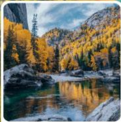
เคอเคอทัวให้อัจฉรัยภูผาหิน