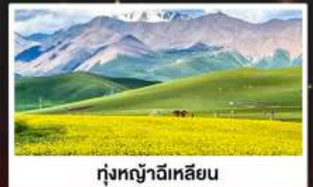
ทุ่งหญ้าจีเหลียน