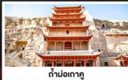
ถ้ำม่อเกาตู