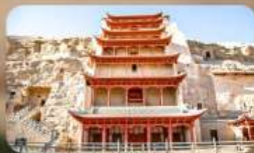
ถ้ำป๋อเกาถู