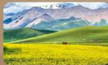
ทุ่งหญ้าซีหลีเยิน