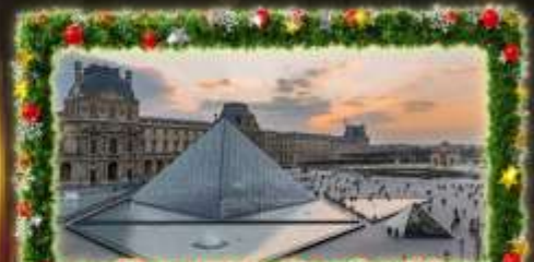
เจ้าชมพีพีร์กันท์ลูฟท์