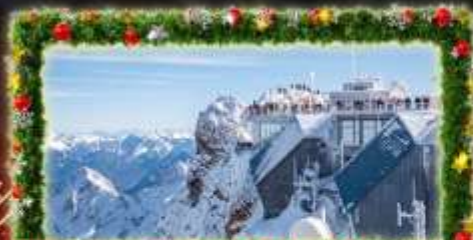
พีชิต Zugspitze Top Of Germany