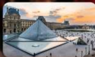
เข้าชมพิพิธภัณฑ์ลูฟวร์