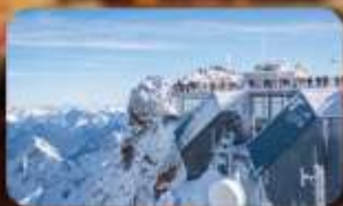
พีชิต Zugspitze Top Of Germany