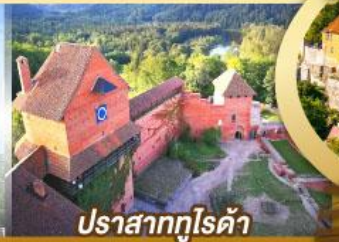
ปราสาทกูไรดา