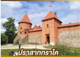
ปราสาททราโค