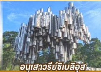
ออบุเสวริย์ซีเบลลูส