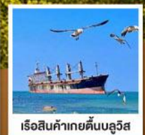
เรือสินค้าเกย์ตันบลูวีส