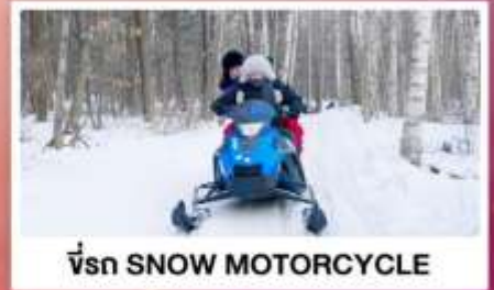
ขี่รถ SNOW MOTORCYCLE