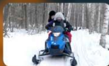
จักรยาน SNOW MOTORCYCLE