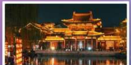
เมืองโบราณลั่วยี่