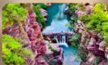
อุทยานหยุ่นโตซาน