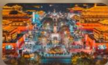
ถนนวัฒนธรรมราชวงศ์ถัง