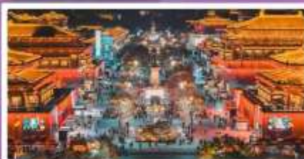
ถนนวัฒนธรรมราชวงศ์ถัง