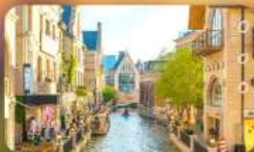
เมืองน้ำเวนิสตะวันออก