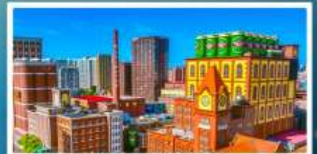
โรงงานเบียร์ซิงเต่า