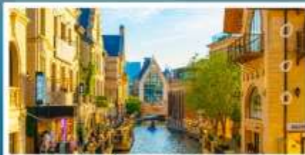
เมืองน้ำเวนิสตะวันออก