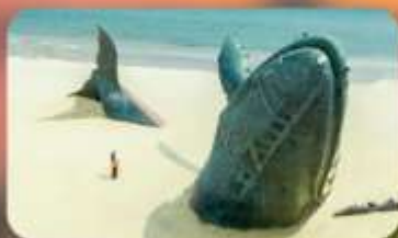
ประติมากรรมวาฬโคดเคี้ยว