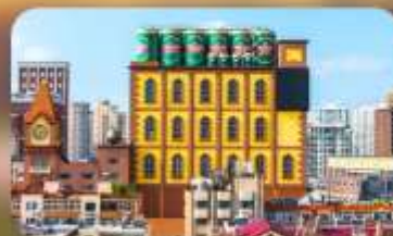
โรงงานเบียร์ซิงเต๋า