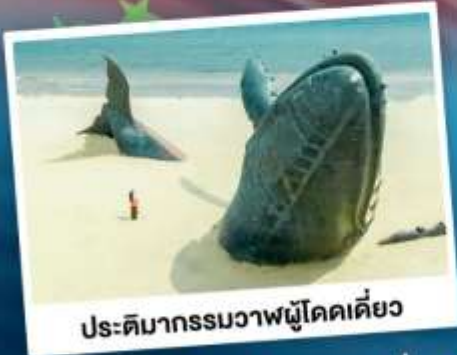
ประติมากรรมวาฬโศกเดี่ยว

เที่ยวเมืองชายทะเลโอปัดดี ซิงเต่า - ต้าหลี่จั้น - ฉะจีจั้นไถ่