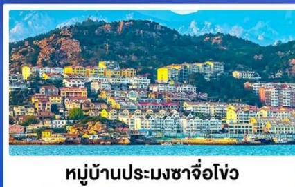
หมู่บ้านประมงซาโจว