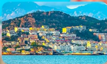
หมู่บ้านประมงซาจื่อโจว