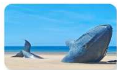
ประติมากรรมวาฬผู้โดคเตี้ยว