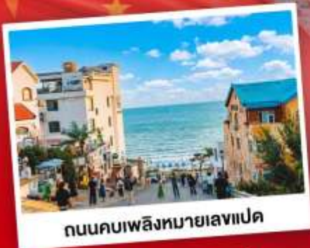
ถนนคอปเปลิงหมายธงแปด