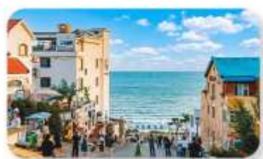
ถนนคนเดินเฟิงสายแปด