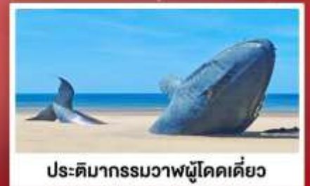
ประติมากรรมวาฬผู้โดดเดี่ยว